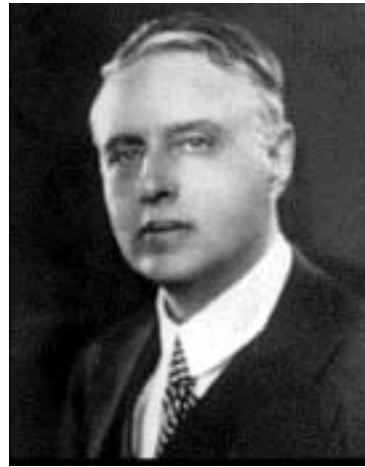
Afonso de Taunay, historiador, grande amigo de Roquette.