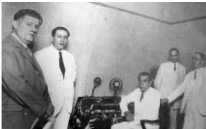
Roquette-Pinto (de pé, ao lado dos equipamentos) e o prefeito Pedro Ernesto (sentado) na inauguração da Rádio Escola Municipal, PRD5, hoje Rádio Roquette-Pinto, em 6 de janeiro de 1934. O retrato, recuperado com demais objetos abandonados, está agora na sala do diretor, prestes a ser pendurado.

Arthur da Távola está convencido de que faz parte das funções do governo, em termos de educação e cultura, bancar uma estrutura de radiodifusão. Coisa com a qual concordamos, e, acredito, Roquette-Pinto também. Seu retrato já pode ir para a parede de novo, porque ele voltou a ser a inspiração da FM que leva seu nome.