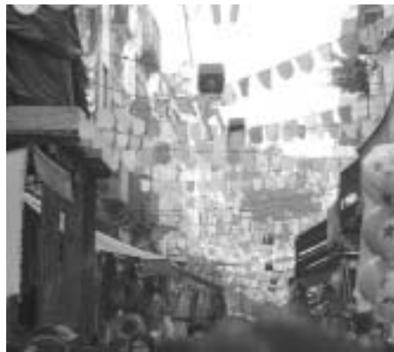
Aspecto de uma das ruas do complexo do SAARA, com suas caixas de som características, veiculando, das 8 da manhã às 19 horas a programação gerada no estúdio abaixo.