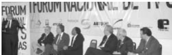
Ao lado de representantes do governo e da sociedade civil, o presidente Lula discursa no encerramento do Fórum Nacional de TVs Públicas.

Fomentar o debate sobre a questão da propriedade intelectual no universo digital, buscando ampliar os mecanismos de compartilhamento do conhecimento. (...)